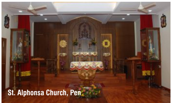
St. Alphonsa Church, Pen