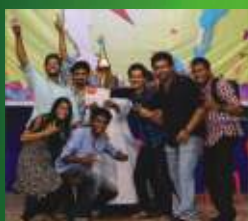
1- Mary Matha Church Kamote