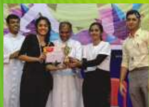
2- St. Joseph Church M C Road