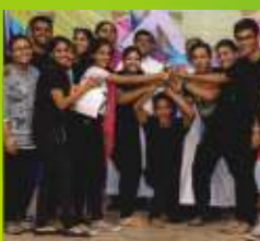
4- Little Flower Church Dahisar