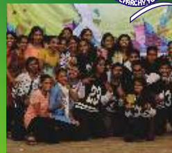
5- St Thomas Cathedral Kalyan (W)