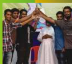
5- St. Thomas Church Mira Road