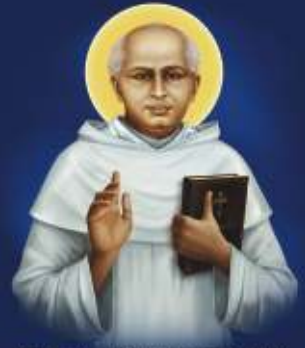
ST. KURIAKOSE ELIAS CHAVARA 1805 - 1871

എല്ലാ മാസാവരളളിയാഴ്ചകളിലും തിരുനാൾ ദിനങ്ങളിലും നൊവേന ഉണ്ടായിരിക്കുന്നതാണ്. കുടുംബങ്ങളുടെ മദ്ധ്യസ്ഥനായ വി. ചാവറയച്ചന്റെ നൊവേനയിൽ പ്രാർത്ഥനാസഹായം ആവശ്യമുള്ളവർ പേരും ഇടവകയും നിയോഗവും അയക്കേണ്ട നമ്പർ 9223344123 (SMS Only)