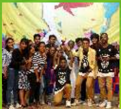
3- Immaculate Conception Church Dombivali