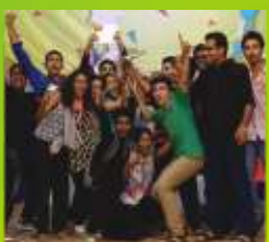
3- St. George Church Panvel