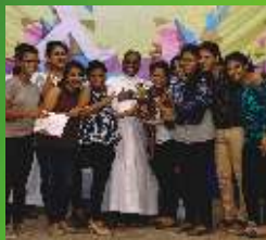
2- St Joseph Church Powai