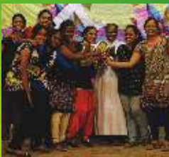
4- St. Alphonsa Church Vasai (W)