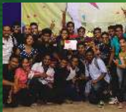
1- Little Flower Church Nerul