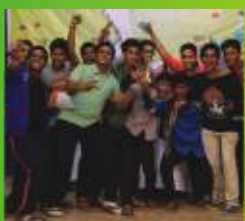
2- Immaculate Conception Church Dombivali