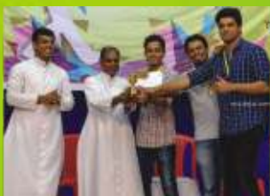
3- St. Kuriakose Church. Kandivali (E)