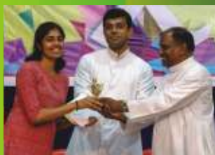
4- Sacred Heart Church Goregoan (E)