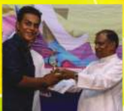
3 - Charles Xavier