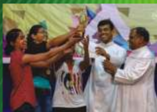
1- St. Thomas Church Borivali