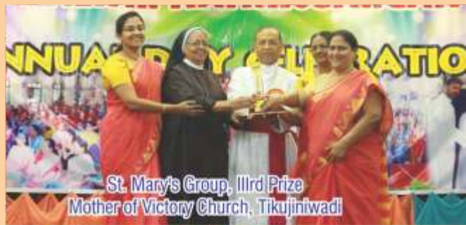
St. Mary's Group, 11rd Prize Mother of Victory Church, Tikujiniwadi