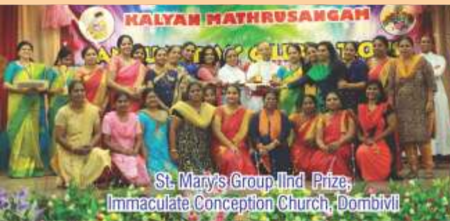
St. Mary's Group 11nd Prize; Immaculate Conception Church, Dombivli