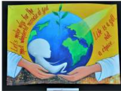
2. Presentation Convent, Nerul