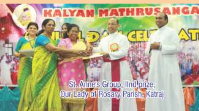
St. Anne's Group, 11nd prize, Our Lady of Rosary Parish, Katraj