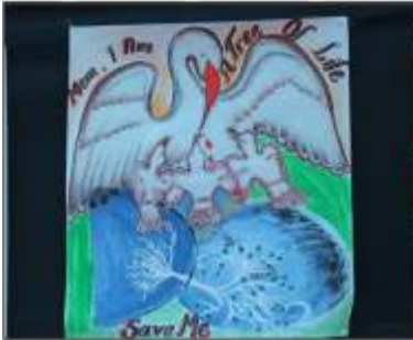
1. Holy Family Congregation, Vasai (W)