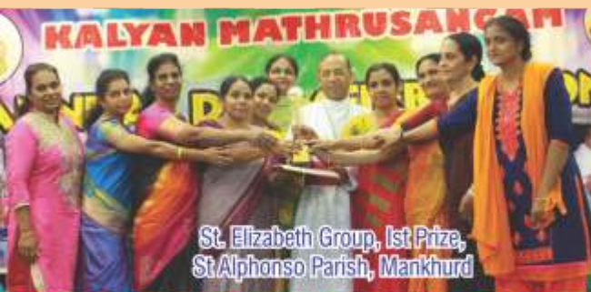
St. Elizabeth Group, 1st Prize, St Alphonso Parish, Mankhurd