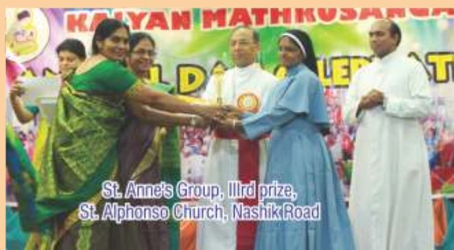
St. Anne's Group, 11rd prize, St. Alphonso Church, Nashik Road