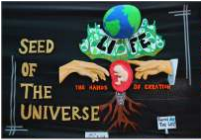
1. Sacred Hart Church, Bhayander