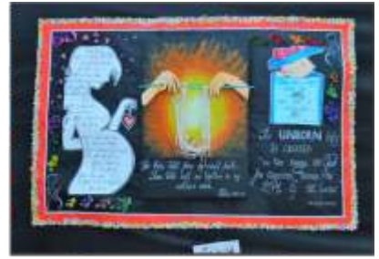
3. Little Flower Forane Church, Nerul