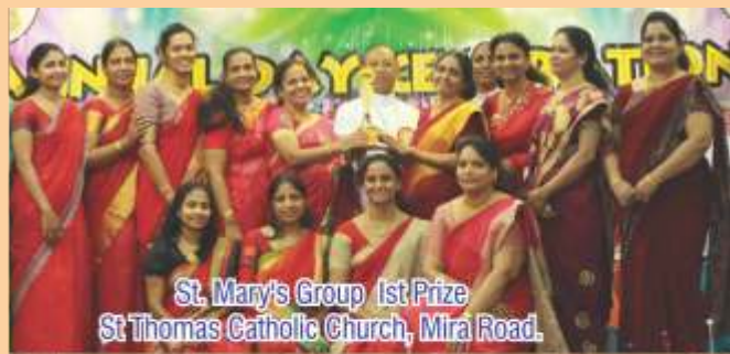
St. Mary's Group 1st Prize St Thomas Catholic Church, Mira Road.