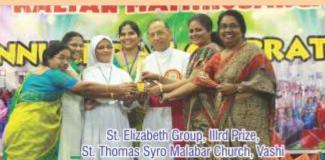
St. Elizabeth Group, 11rd Prize, St. Thomas Syro Malabar Church, Vashi