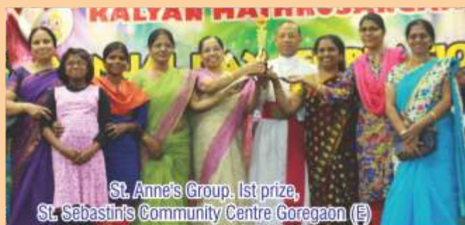
St. Anne's Group, 1st prize, St. Sebastian's Community Centre Goregaon (E)