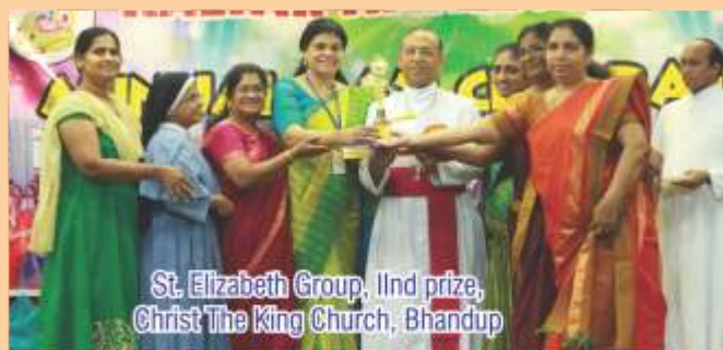
St. Elizabeth Group, 11nd prize, Christ The King Church, Bhandup