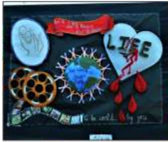
2. St. Thomas Church, Dapodi