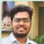
ANIT ROY DEXCO, Kalyan Diocese

“It was to know the real status of the diocese by way of evaluation of the past and to plan for the future that I came to attend the 3rd Eparchial Assembly of our diocese. It was very well planned and organised systematically; the topics discussed were relevant. Active participation from the laity showcased that the future plans of the Assembly would be carried out fruitfully. It is heartening to note that our priests were enthusiastic and energetic to contribute to the success of the Assembly.”