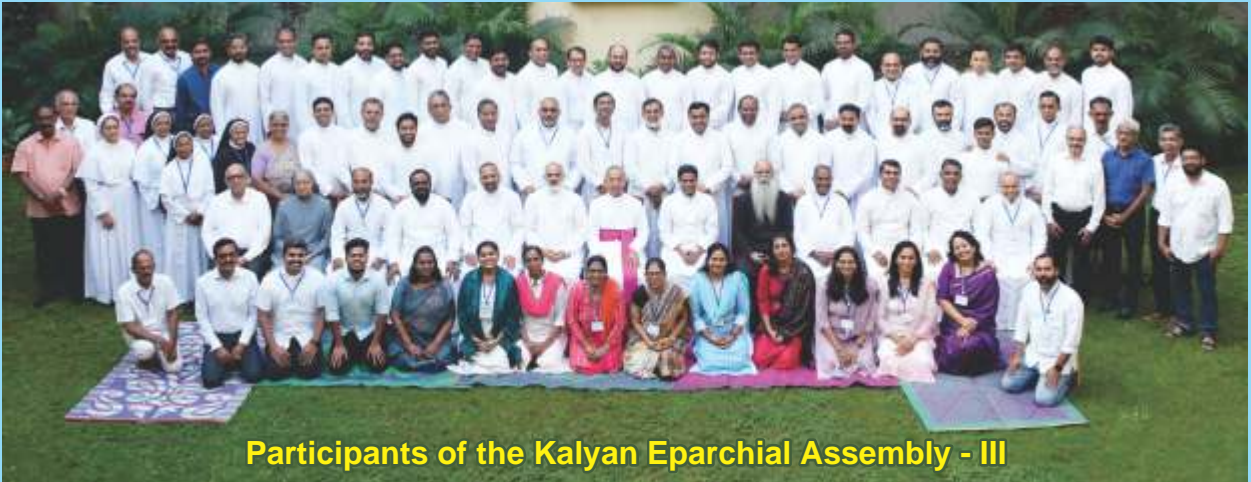
Participants of the Kalyan Eparchial Assembly - III