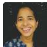
Rosemary Johnson Little Flower Church, Dahisar

Mail your answers to lanternkidsroom@gmail.com mentioning your name, catechism section and parish before 20th January, 2024 . Names of selected winners will be published in the next issue of Kalyan Lantern.