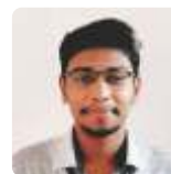
Compiled by Joel Chacko Christ the King Church, Bhandup

Let us all strive to grow in grace and love as a family rooted in Christ, giving rise to many more saints, in an age when the Church needs them the most.